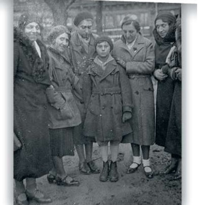
De UGent was een aantrekkingspool voor Joodse studenten en hun families.